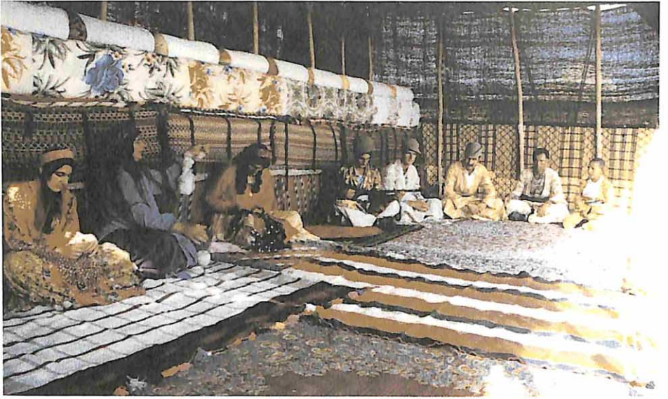
İran göçebe Türklerinde çadırdan bir görünüm